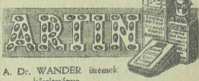
A. Dr. WANDER üzemek készítménye.

Új emberré varázsolja az ARTIN, az ideális hashajtó.