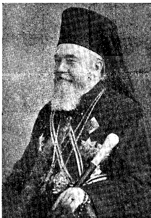
I. P. S. Dr. NICOLAE BĂLAN Mitropolitul Ardealului