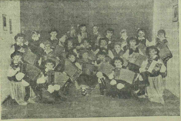
A kis szerb harmónikás művészek hangversenye 22. és 23-án lesz.