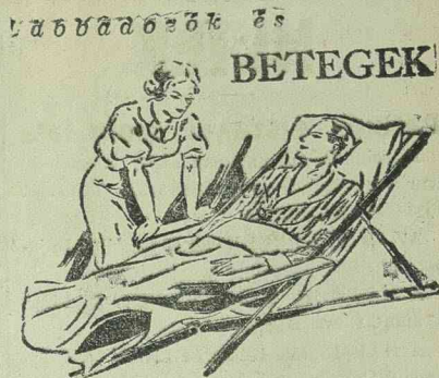
BETEGEK majdnem kivétel nélkül állandóan SZÉKREKEDÉSBEN szenvednek

lini tegnap újabb rendeletet adott ki, amely az 1911. évi korosztály behívásáról intézkedik. Ezt a korosztályt egy hónappal hívták be. A Giornale d'Italia című lap szerint az 1911. évi korosztály mozgósítására azért volt szükség, hogy Olaszország megmutassa a maga erejét és azt, hogy minden eshetőségre készen áll. Olaszországnak jelenleg hatszáz ezer katonája áll zászlók alatt.