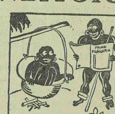
Mért nem eszi meg a kannibál az apját? Olvassa Tolnai karácsonyi lapját.