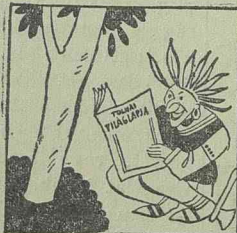
Szép szines tollidisz az indián kalapja. Három melléklet a Tolnai alapja.