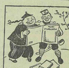
Nagyon csodálkozik a nagy dömping apja: Tolnai még olcsóbb, mint a japán lapja.