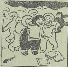
Eszkimóknak nem kell jegesmedve, jóka. Tolnait olvassák tegnap este óta.