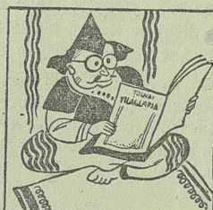
Ugyan mi érdekli a Dalai lámát? Megvette Tolnai karácsonyi számát.