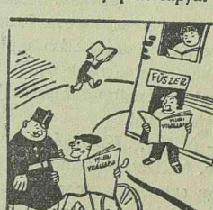
Akár jobbra, akár balra, bárhová is nézel, Tolnait olvassák nagy érdeklődéssel.