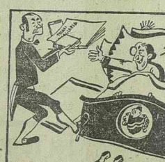
Tanít, mulattal és bajtól véd is, óv is... Tolnait olvassa még a kényes gróf is.