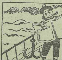
Vihar dül és mégse múlt el a jókedve. Tolnait nézi a vén tengeri medve.