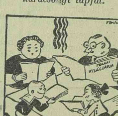
Sokbeszédnek — tudják? — semmire az alja. Ergo: mindenki a szép Tolnait falja.

Tolnai Világlapja duplaferjedelmű, 112 oldalas karácsonyi száma három remek melléklettel: 1. Arnold Bennett: „Az áruház rejtyele” című regényével, 2. Mark Twain: „Koldus és királyfi” c. ifjúsági könyvével és 3. Egy pompás regénnyel, izléses kötésben jelent meg.