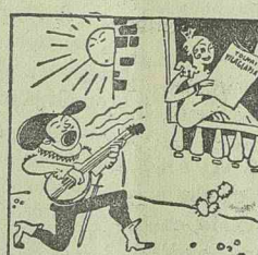
Peng a gitár halkán, éjjelt üt az óra... Tolnait olvassa a spanyol szenyóra.