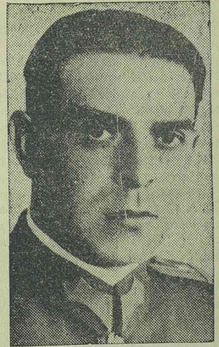
Massini Egizio alezredes

Szombaton, július 28-án este kilenc órakor rendkívüli mértékben is nagyszerű zenei esemény színhelye lesz az Electrica-pálya. A reflektorokkal fényesen kivilágított pályán hétszáz zenész, mind-egyik művésze hangszerének, fog monstrehangversenyt rendezni, amilyen városunkban eddig még nem volt. A monstrezenekar tagjai különleges és magukkal hozott óriási emelvényen helyezkednek majd el, hogy olyan zenei élvezetben részesítsék a közönséget, amely nagyszerűségében minden eddigi zenei eseményt felülmul. A hangverseny műsorán Beethoven nagyszerű ötödik szimfóniája, Enescu: Rumänisches Poem című zeneszáma, Chopin: Polonaise és Tschai-