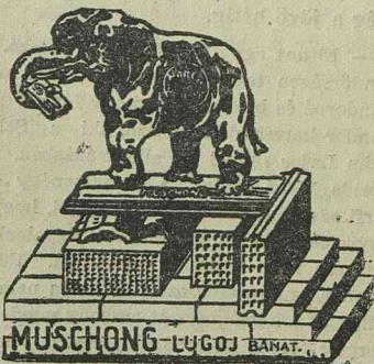
MUSCHONG LUGOJ BANAT.

már megindul a tréning. A nyeny a főváros legjobb motorosai, de meghívták még a clujvári Popp és Forryt is, akiket ketten jónévi versenyzők. A különben a motoros versenyek még kerékpáros versenyekkel szitáltak, amelyeken a Timisoara kerékpáros gárda az aradzókkel fog megküzdeni. A véggramja a következő: Motoros, motoros amatőrverseny, oldboyverseny kísérelve, ke-seny, motoros pálya-rekord kerékpáros pálya-rekord kísérelve iránt máris nagy érdeklődés vanul meg nemcsak városban, hanem a fővárosban is, ahonnan érdeklődő fog a fővárosi verséretében a versenyen megjel