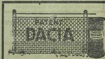
Fióküzlet Józsefváros, Kossuth Lajos-utca 31. (Bejárati Bem-utca)

* Fáj a gyomra? Nincsen fő étvágya? Bélműködése rendetlen? Székrekedésben szenved? Nyugtalanul alszik? Ideges és fáj a feje? Egyedül jól ható szer a dr. Földes-féle Angol gyomorbalzsam. Egy üveg ára 90 lei. Kizárólagosan szállítja dr. Földes Béla gyógyszerész, Arad, Str. Eminescu 21. Postán utánvétel megrendelhető egy levelezőlapon.