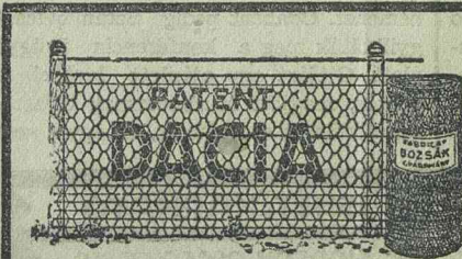
Fióküzlet Józsefváros, Kossuth Lajos-utca 31. (Bejárát Bem-utca)

— Megvalósul mégis a városi zenekar. Urletianu Radu, az ismert temesvári karnagy, már régebben föl tette a városi zenekar tervét. Ennek a tervnek az alapján most Gredinariu Emil városi kulturatanácsnok javaslatot dolgozott ki a városi zenekar létesítésére. A javaslat szerint a terv olyan formában valósulna meg, hogy egyetlen banival sem terhelne meg a városi költségvetést, ezzel szemben azonban huszonhét hivatásos zenésznek és azok családjainak adna biztos kenyeret. A város állandó választmánya foglalkozott a városi zenekar felállításának tervével és ahhoz elvben hozzájárult. A javaslat részletes áttanulmányozására bizottságot küldtek ki, amelynek tagjai Nicolae vici Pál dr. alpolgármester, Gyula János dr. és Probst János.