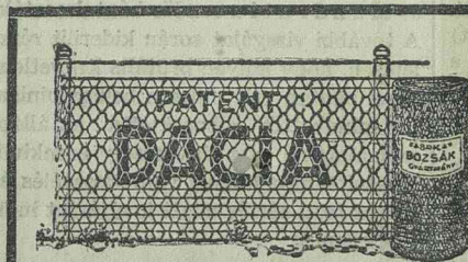
Fiókküzet Józsefváros, Kossuth Lajos-utca 31. (Bejárat Bem-utca)