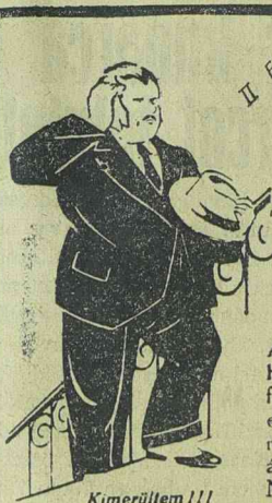
Kimerültem!!! URODONAL-t kellennem!

A szállodában étterem, kávéház és american bar. Szobáink árát mérsékeltük. E lapra hivatkozók 20 százalékos engedményt kapnak. Központi fűtés, folyó hideg-meleg víz, lift, telefonos szobák. Teljes komfort.