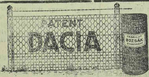
Nagy készletek: „Dacia”, „Bánát” 6-szögletes és 4-szögletes kerítésfontanban.

Hétfő Belvárosi Capitol mozi: Trader Horn (Hangos film). Forum mozi: A tánccos huszár (Beszélő film-operett). Gyárvárosi Apolló mozi: A senki országa (Beszélő film).