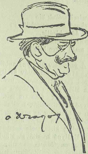
Vaida visszautazott Kolozsvárra

Az idézet tartalma az, hogy Maniu a kisebbségek részére egyforma elbánást követelt a tisztelt Háztól.