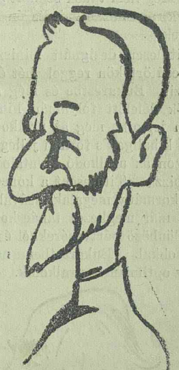
A rejtélyes Averescu

Legújabb jelentések szerint Maniu Gyula bizalmasan értesítette híveit, hogy ő hozzájárul a koncentrációhoz és ebben a hozzájárulásban új momentumként biztosra vehető, hogy Titulescu és Maniu Párisban folytatott tárgyalásaik alkalmával ebben a kérdésben már elvben meg is állapodtak.