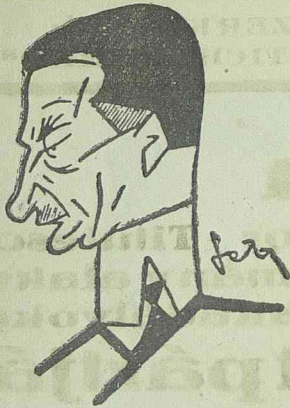
Maniu támogatja Titulescut

Titulescu különben utban van hazafelé. A párisi pályaudvaron Londonból való megérkezése alkalmából Briand megbízásából a külügyminiszterium államtitkára üdvözölte, azonkívül megjelent a pá-