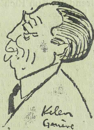
Titulescu a jövő embere

Vasárnap és hétfő politikai tárgyalásokkal telt el. Duca társaság között Pop Cicio kamarai elnökkel és közölte, hogy a liberálisok hajlandók koncentrációs kormányt támogatni. Franasovici viszont Hatiegan Emillel folytatott tárgyalásokat, Inculeț Mihalachival tartott megbe-