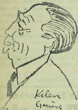
Kelen Gábor TITULESCU

Mironescu miniszterelnök külföldi utazása, továbbá az utazáshoz fűzött különböző kombinációk, Titulescu és Maniu külföldi tárgyalásai képezik ma a politikai körökben az érdeklődés tárgyát. Mironescu miniszterelnök Budapesten keresztül utazott külföldre és tegnap reggel hét órakor az Orient Expresszel érkezett meg Budapestre. A keleti pályaudvaron a miniszterelnököt Grigorcea budapesti román követ és a román követség személyzete várta. Mironescu elbeszélgetett a követvel és a követség tagjaival, majd rövid tartózkodás után az Expressz folytatta útját Svájc felé.