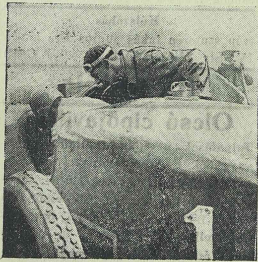
A herceg vizsgálja gépét.