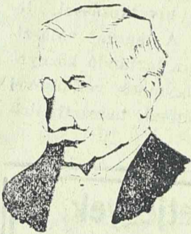
Az embert barátjáról...

* Koresolyák és ródlik, gyermekfűzőedények, karácsonyi cikkek és az összes téli cikkek nagy választékban leszállított áron Scherter Ottó vaskereskedésében, Timisoara, Belváros.