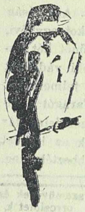
A madarak tolmárol...

— Elítelt kommunisták. Nagybecskerekéről jelentik: A nagybecskereki törvényszék előtt napokon át tárgyalták a nemrégiben leleplezett kommunisták bűnügvét. Az ítéletet tegnap hirdették ki és a törvényszék kommunista propaganda és szervezkedés miatt nyolc vádlottat egy-egy évi fegyházra ítelt. Nyolc másik vádlottat a törvényszék felmentett.