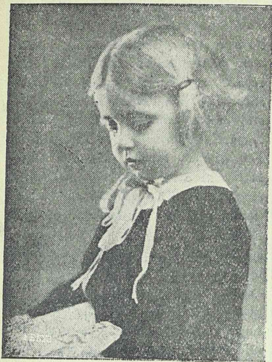
A Déli Hírlap által rendezett szépségversenyen az első díj nyertese