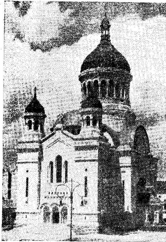
Catedrala din Cluj