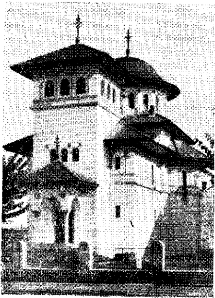
Biserica „Sf. Nicolae“ din Cluj