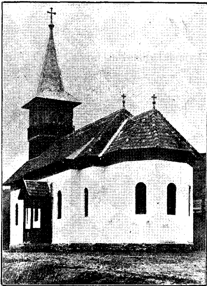
Noua biserică ortodoxă română din Poșaga.