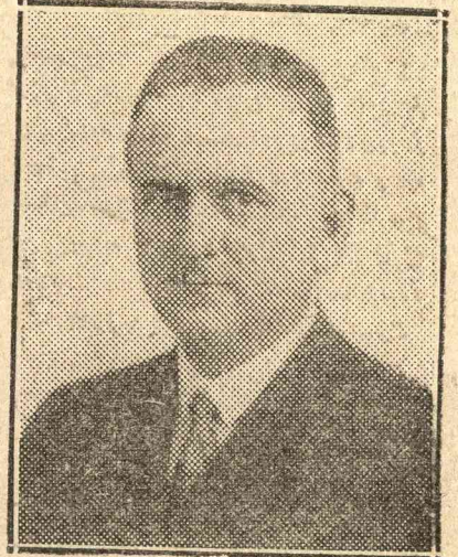
Dr. Pop Valér igazságügyminiszter, akinek liberális szellemű új állampolgársági törvénye jogaikhoz juttatja a hontalanok tizezeit.

Dr. Pop Valér igazságügyminiszter benyújtotta állampolgársági tervezetét, amely végre módot ad arra, hogy azok a tizezrek, akik kimaradtak az állampolgársági listákból, — habár minden joguk meg volt hozzá — végre hozzájuthassanak az őket megillető jogokhoz.