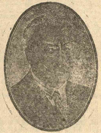
Vajda-Voevod Sándor volt miniszterelnök, a nemzeti parasztpárt alelnöke

Vajda-Voevod Sándor, a nemzeti-parasztpárt alelnöke most töltötte be a hatvanadik életévét. Pártja ez alkalmából nagy ünneplésben kívánja részesíteni az ősz politikust. Vajda-Voevod Sándor neve hosszú évtizedek óta közismert a politikai életben. A magyar parlamentben egyike volt a legharcosabb nemzetiségi képviselőknek. Az impérium változás után a Consiliul Dirigent tagja, majd 1920-ban, mint miniszterelnök képviseli Romániát a béketárgyalásokon. 1928-ban, Maniu kormányában mint belügyminiszter szerepelt. Ekkor összekülönbözött regáti politikai barátjaival és kijelentette, hogy nem megy többé Bukarestbe mindaddig, amíg Maniu ismét miniszterelnök nem lesz. Számos ízben hívták Vajdát Bukarestbe igen fontos pártülésekre, de nem ment. Kolozsvári visszavonultságából csak most bujt elő, amikor a királyi meghívó a Ferdinánd rend lovagjainak vacsorájára hívta. Vajda a királyi vacsora után Bukarestben maradt és királyi kihallgatáson jelent meg. Hatvan éves fejjel most újra kezdi a politikai harcot, fiatalos erővel, ifju lendülettel.