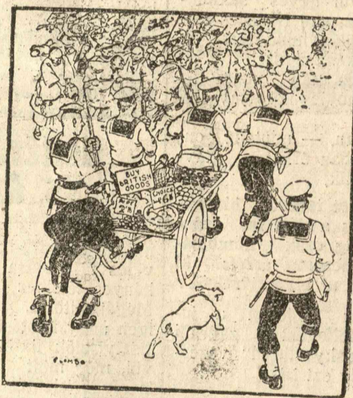
Barátságos átvonulás K nán