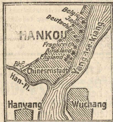
Az egész világ érdeklődése Kína felé fordult, ahol az európaiak

helyzete komolyan aggasztó. Mint a térképen látható: az európaiak a Yang-tse-Kiang partján egy széles sávon helyezkedtek el s így egy támadás ellen meglehetősen nehéz lesz védekezniük. Mindenesetre az európai csapatok erősítése egyre tart és a lakosságot meg fogják tudni védelmezni. Az esetleges támadások központja csak Hankou lehet.