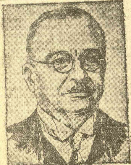
METAXAS MINISZTERELNÖK, Görögország rendkívül népszerű miniszterelnöke immár két éve látja el igen fontos hivatalát. Mint a Balkán-szövetség elnöke, most Szalonikiben aláírta a bulgár fegyverkezési egyenjogúságról szóló szerződést.

(DANZIG.) (Reuter.) A danzigi tanács rendeletére megvonták a gyakorló jogot az összes danzigi zsidó vallású orvosoktól. A rendelkezés igen nagy feltűnést és megütközést keltett különösen Genfben, ahol ezt törvénytelennek minősítik.