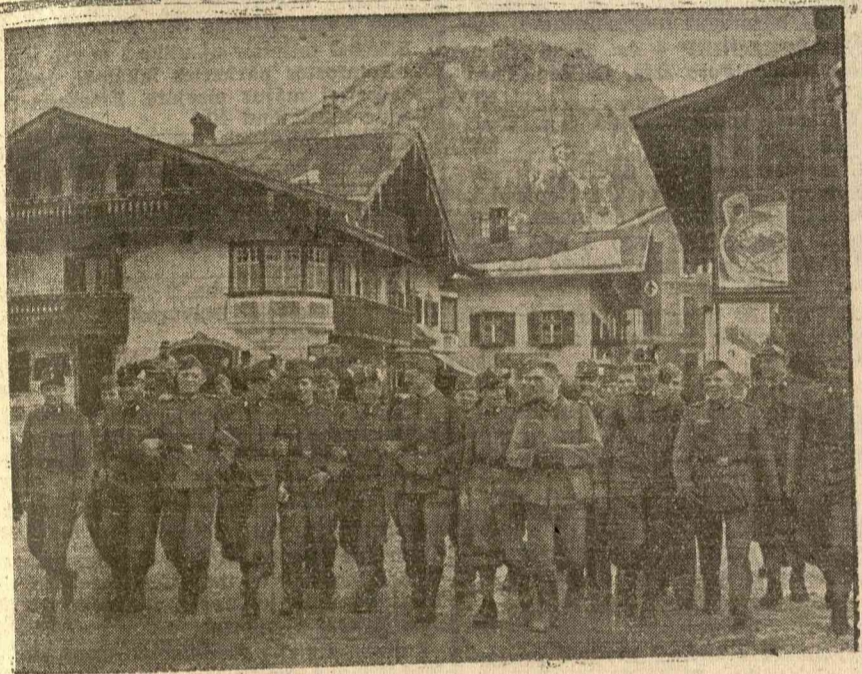
A „felszabadulás” napjának örömmünnepe Wörglben, egy kis tiroli helységben a lakosság és az osztrák bajtársak kitorzó örömmel fogadták a bevonuló német katonákat, akikkel kart karba fonva haladnak együtt a kis helyiség uccáin.

— Az ember előbbrevaló, mint a gép. Párisból jelentik: A Közlekedési bizottság tulnyomó többséggel kimondotta, hogy az életbe léptetendő új közlekedési szabályok új szellemben szerkesztendők. Ez az új szellem vegye figyelembe hogy a lakosság tulnyomó többsége gyakorló s így az ő közlekedésének megkönnyítése legyen a főszempont, nem pedig a törpe kisebbséget alkotó gépkocsiközönségé.