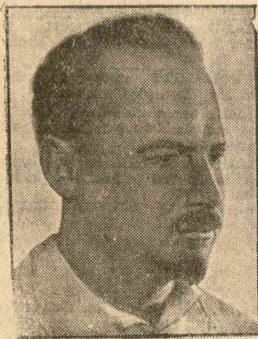
Bucharin volt népbiztos, a moszkvai újabb per egyik főszereplő-vádlottja.

ROYAL MOZGÓ: Tengeri titánok. Főszerepben: Freddie Bartholomew, Lionel Barrymore és Micky Rooney.