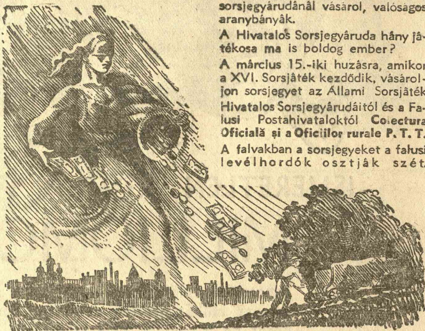
Helyi cím: CLUJ, STRADA REGINA MARIA No. 46.

A sorsjegyek, amelyeket ennél a sorsjegyarudánál vásárol, valóságos aranybányák.