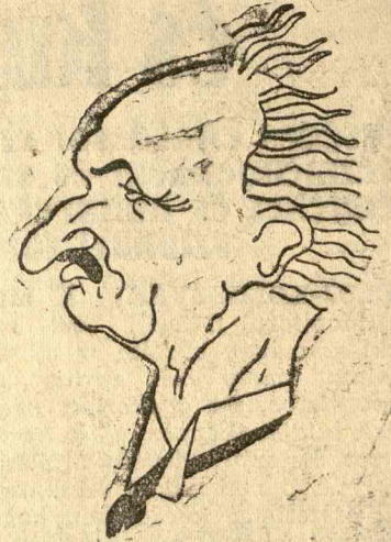
CHAUTEMPS az új francia miniszterelnök, aki Blum örökébe lépett.