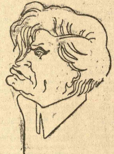
PAUL BONCOUR többszörös miniszter, aki tárcanélküli miniszterséggé váltalt az új kabinetben.