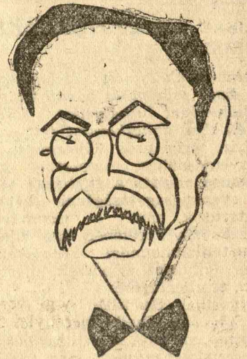
LEON BLUM a volt miniszterelnök, aki a Chautemps-kormányban helyettes miniszterelnök lett.