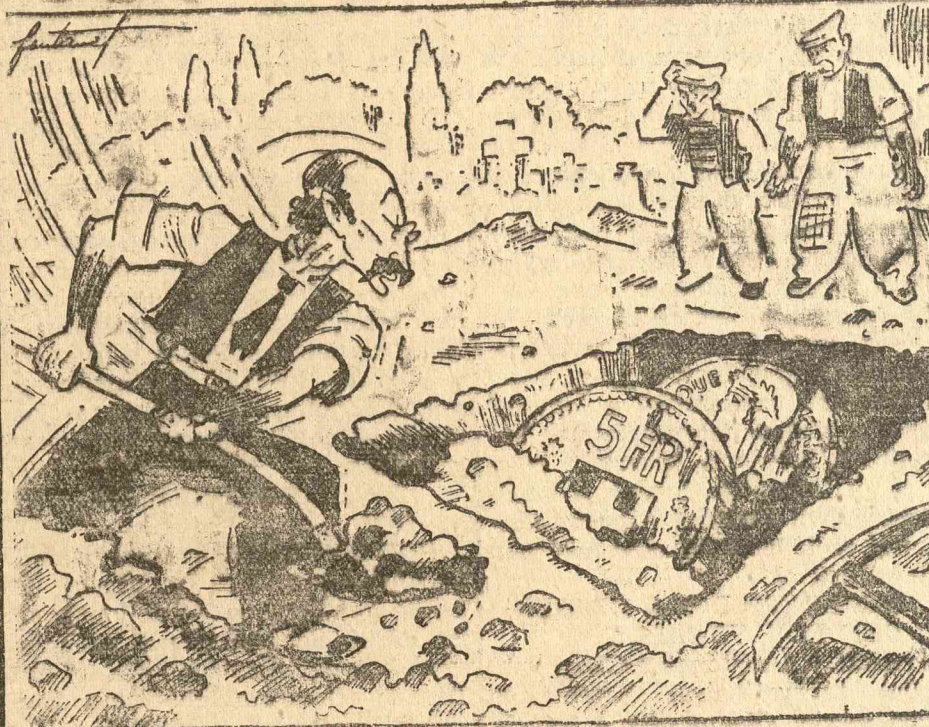
Leon Blum: Asó, vagy, kapa válasszon el egymástól.

Indulás minden hétfőn este a 8.25 órás gyorsvonattal, bőrülékes külön Pullmann kocsiban. — Visszautá- zás szerdán este 8.45 órakor. — Jegyek válthatók „CENTROPE” utazási vállalat képviselője, „AGIMEX” ügynökségnél, Cluj, Piata Unirii No. 3. Telefon 2-29.