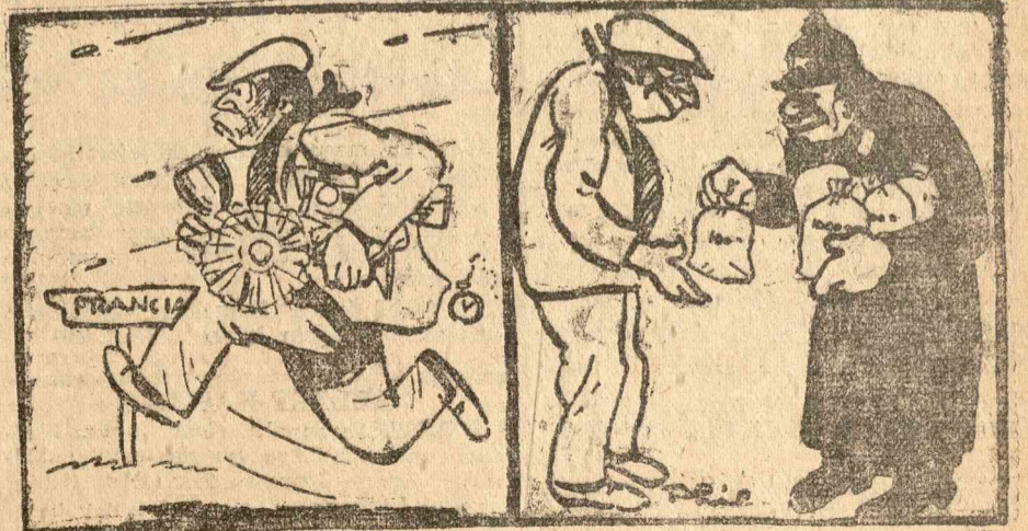
1500 méteres futás a spanyol-francia határon át és a hősök jutalmazása