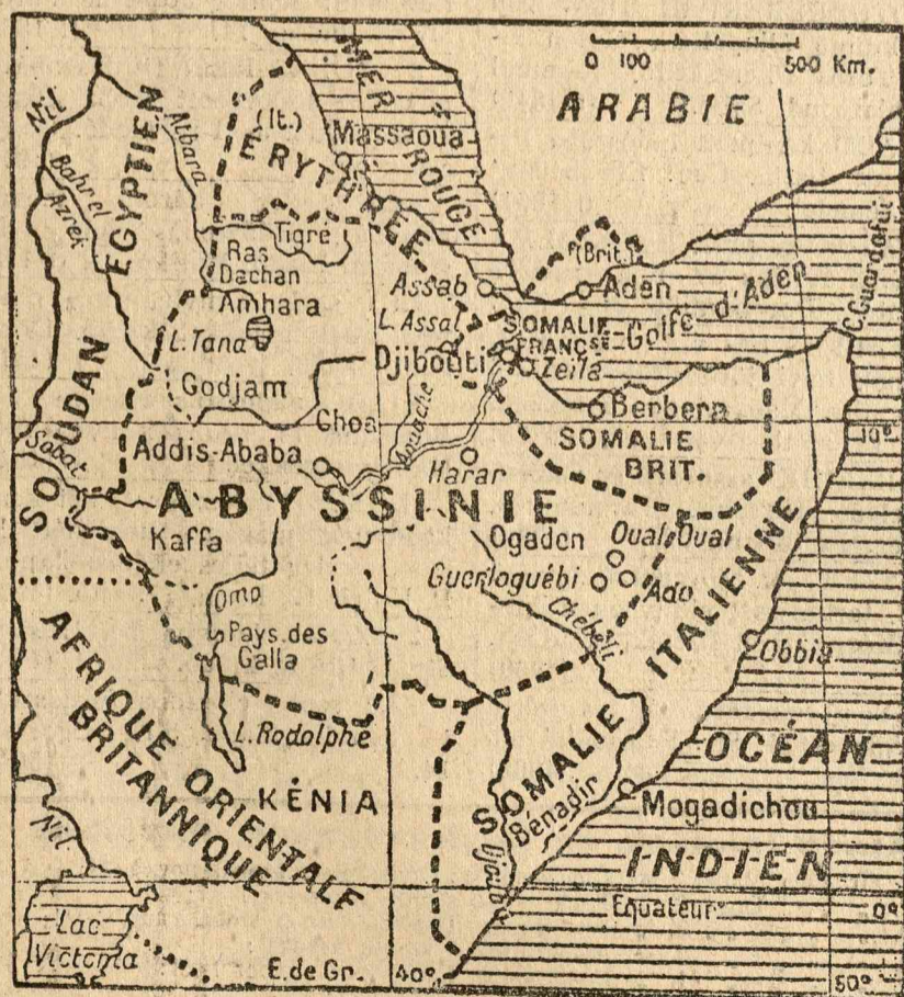
Abesszinia és a környező angol-francia-olasz gyarmati érdekeltségek. Abesszinia északnyugati részén van a híres Tana tó, amelyből a Nilus fő forrásfolyója kiszakad.

— OLVASÓINK FIGYELMÉBE! Ezuton közöljük összes olvasóinkkal, hogy bucurestii megbizottunk minden olt elintézendő ügyben szívesen szolgálnak információkkal és szükség esetén személyes közbenjárással is olvasóink rendelkezésére áll. Lapunkra való hivatkozással vele közvetlenül kérjük bármiféle ügyben érintkezésbe lépni BUCURESTI, Str. Grivitei No. 107. szám alatt Administratia „Jóestét!” címen. (Hátul az udvarban).