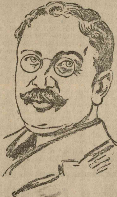
Lerroux spanyol miniszterelnök, akinek jobboldali kormányát, mindjárt kormányrajutásuk után, az egységes baloldali pártok forradalmi megmozdulása válságos helyzetbe juttatta.

— Főur, tudja mit? Hozzon még egy kávét!