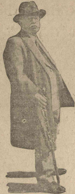
Duroro Wladimir, világhírű orosz cirkuszi clown és állatidomító, 72 éves korában meghalt. A kiváló állatpszichológust a Szovjet nagy pompával temették el Moszkvában.

★ Huzella — Általános biológia, 349 oldal, 105 ábrával. Ára 660 lej. Kiadja a Magyar Orvosi Könyvkiadó Társulat. A könyv illyzerű és házagpótló és első ilyen könyv a magyar orvosi irodalomban. Átvezeti az olvasót a szerkesztés legérdekesebb és legfontosabb kérdéseinek. Nemcsak az orvosnak és természetvizsgálónak tett ezzel szolgálatot, hanem tanulságos és élvezetes olvasmányt nyújtott vele minden művelt olvasónak. A kiténő mű kapható a Brassói Lapok könyvosztályában, Brassó, Kapu-utca 56—58., az udvarban.