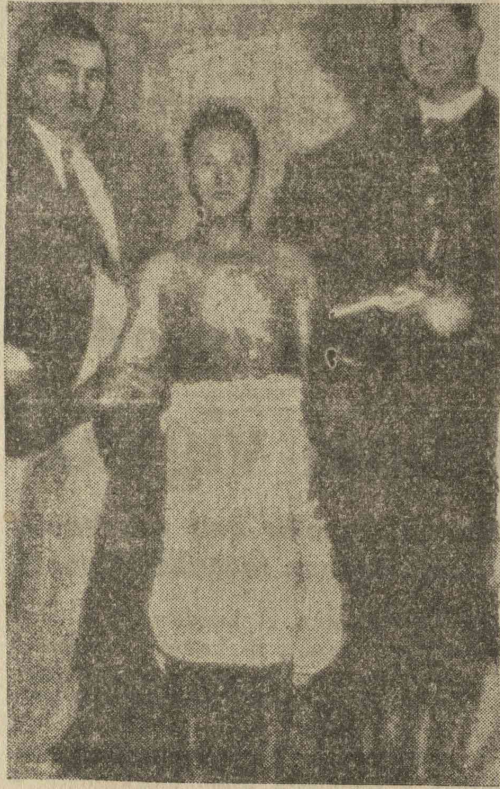
A merénylet képe, amelyet Amerikából rádió-képközvetítéssel továbbítottak Európába.