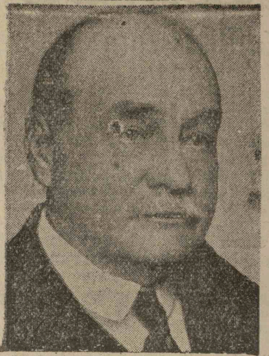
1. Zamorra, Spanyolország köztársasági elnöke, 2. Dr. Gördelers, Németország árszabályozó kormánybiztosa, 3. Adams-asszony, az Amerikában székelő Nemzetközi Békeliiga elnöke és 4. Butler newyorki egyetemi tanár, akik az idei beke-Nobeldíjat kapják.