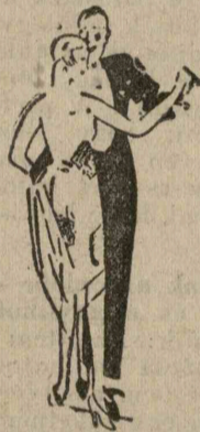
Táncőrület a nyomorúság tetején

Esküvői bonyodalom hibás meghívók miatt. Londonból jelentik: Vigjátékba illő jelenetek játszódtak le a londoni előkelő társaságban két esküvő alkalmából. Az angol főváros szívében egymás mellett van a Westminster-székesegyház és az előkelő Margeret-templom. Csütörtökön mindkét templomban előkelő közönség gyűlt össze. A meghívott vendégek pontosan megjelentek a templomban, meglepetésükre azonban idegen menyasszony és vőlegény állott az oltár előtt. Azt hitték, hogy más esküvő van soron és időtöltésből végignézték az idegen esküvőt. Amikor azonban hosszú várakozás után sem jelent meg a mátkapár, érdeklődni kezdtek s kiderült, hogy félreértés történt. A két esküvőre egy nyomda készítette a meghívókat és tévedésből felcserélte a templom címét. Így történt azután, hogy a meghívott vendégek idegen esküvőt néztek végig, mialatt a szomszédos templomban az a mátkapár esküvőt, amelyre vártak.