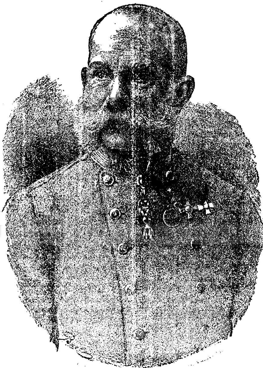
M. Sa Monarchul Francisc Iosif I., Impărat și Rege.

La oarele 11 toți membrii s'au întrunit în salonul casei parochiale, pe care Multonoratul domn protopop a avut bunăvoința de a-l pune la dispoziția reuniunii pentru ținerea adunării sale generale. O comisiune anume aleasă, condusă de Rev. domn