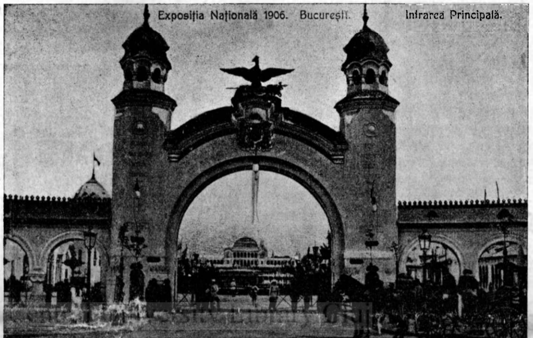
Poarta Expoziţiei din Bucureşti (întrarea principală).

Pentru a treia oară să întruneşte »Asociaţiunea« noastră în adunare generală în Braşov, după un restimp de 23 ani dela întrunirea a doua, şi de 44 ani dela cea dintâiu. Adunarea din a 1883 s'a distins prin hotărîrea înfiinţării şcolii civile de fete din Sibiului, care a adus servicii așa de însemnate societăţii noastre şi care să socoteşte cu drept cuvânt ca un mărgăritar al instituţiunilor noastre şcolare. Şi mai însemnată însă, atât prin numărul şi starea socială a participanţilor, cât şi prin înălţimea problemelor dezbătute şi a entuziasmului, ce a domnit într'ânsa, a fost adunarea din a. 1862, ținută tot în localul, în care ne