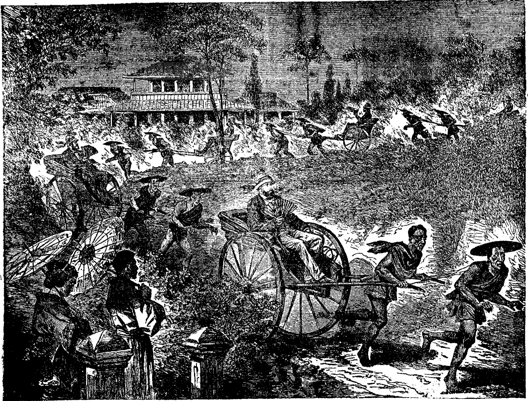
Distraacțiile în Iaponia.

vegetațiunea înșelată de o căldură de vară a pornit repede înainte. Plantele sămănate creșteau văzând cu ochii, pomii și vița au înfrunzit și înflorit, oamenii se grăbeau a pune răsaduri în pământul liber în convingerea că timpul este suprem pentru a îndeplini lucrările câmpului și în grădini și vii. Dar' ne-am înșelată cu toții în presupunerile noastre că iarna ne-ar fi părăsit, pentru a re-