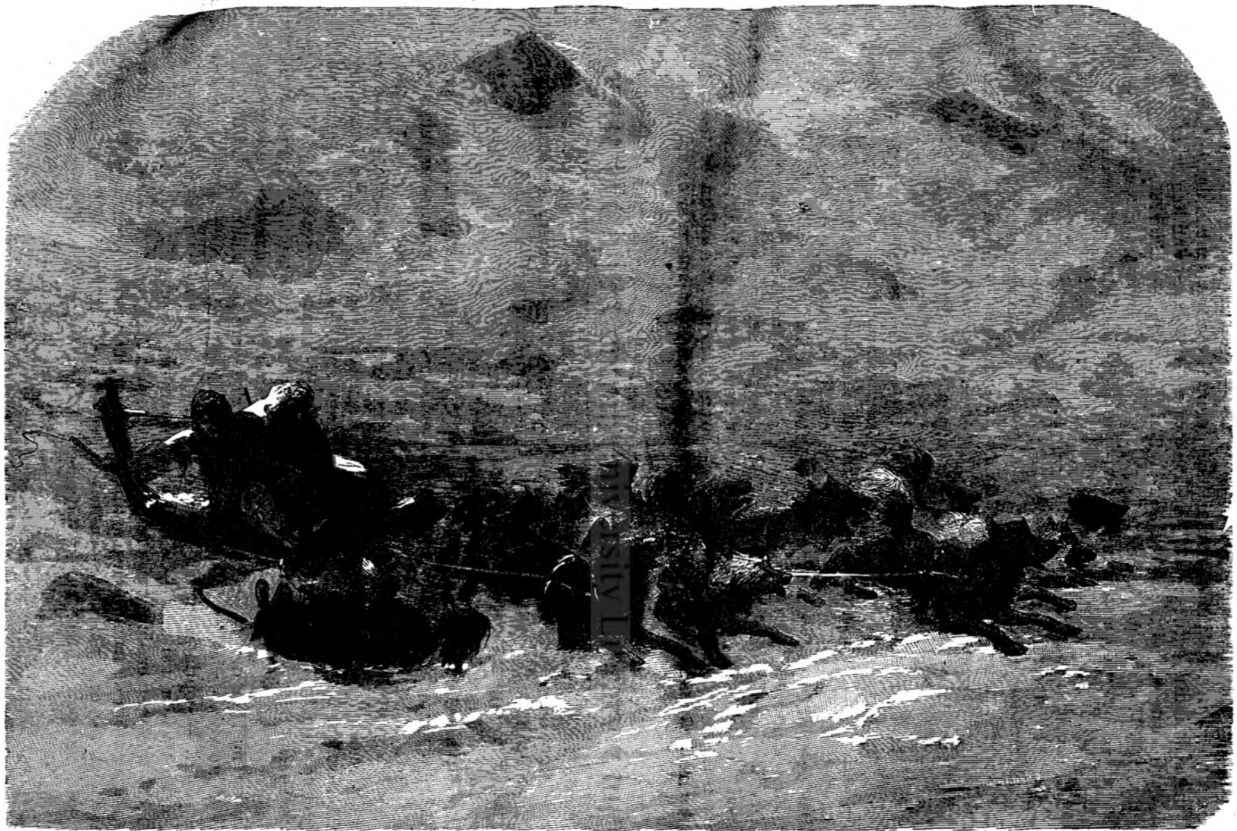
Canii din Camciatca .