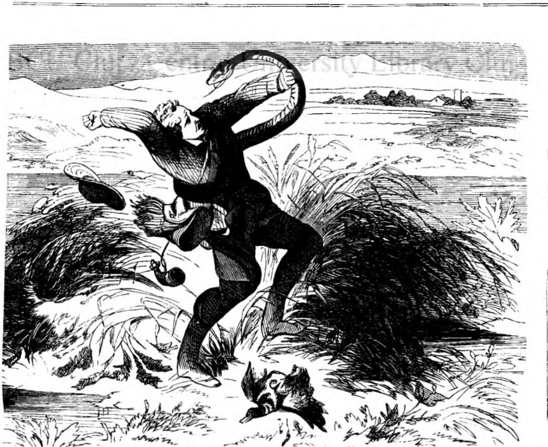
Lupt'a cu unu sierpe negru.

Pretiuu pe anu 10 fl., pentru Roman'ia 2 galbeni.