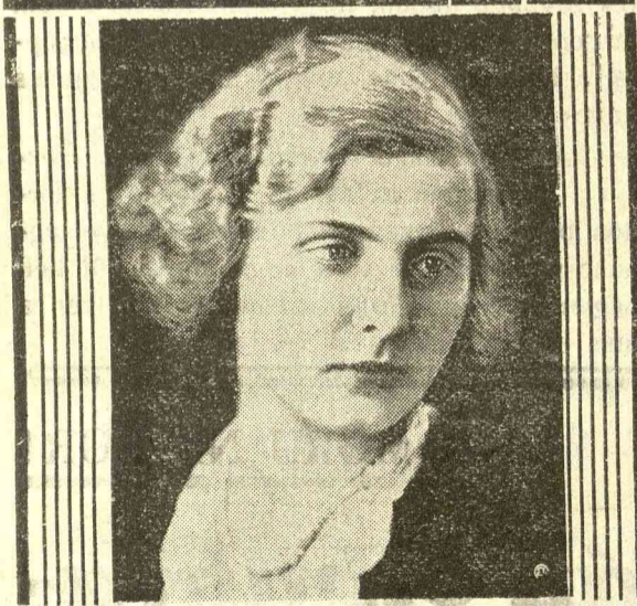
Az osztrák szépségkirálynő

Legújabb jelentés közli, hogy a timisoarai tankerületi főigazgatóság-hoz érkezett miniszteri rendelet értelmében az elbukott tanítók 1935. szeptemberében újabb vizsgára állhatnak, azonban csakis azok, akik nem tanítják a román nyelvet, földrajzot, vagy történelmet.