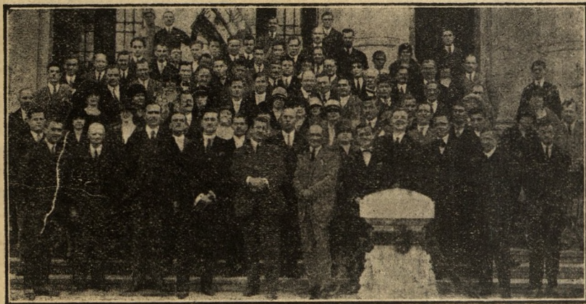
Congresiștii la mormântul „Soldatului necunoscut” din Parcul Carol.

Dat însă fiind cazul că între surdo-mușii români și cei din teritoriile alipite, cari fuseseră instruiți în o altă limbă și cultură cu directive opuse, erau divergen-