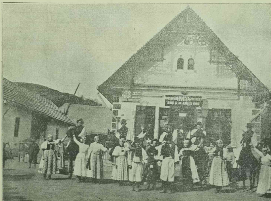
A Hangya fogy. szövetkezet Almaşul községben, Kalotaszegvidéken.

Aki takarékosan, beosztással él, az kerül a bolti hitelt, mert ez romlásba viszi nemcsak a családját, hanem a szövetkezetét is. A haladni vágyó gazda, vagy háziasszony pedig nemcsak a családja sorsát, hanem a szövetkezet jövőjét is szívén viseli, mert a szövetkezetek családiháztartások legjobb támaszai. Vessük tehát szívünkbe ezt a komoly intést mindentelé, ahol fogyasztási szövetkezet van és „Ne vásároljunk hitelben!”