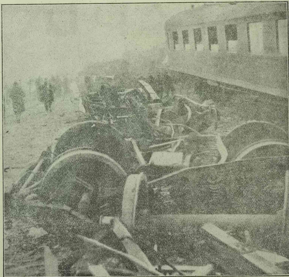
A lagny-i vasúti katasztrófa színhelye. Az elliport gyorsvonat romjai, jobboldalt az expressz egyik kocsija.

A Párishoz közelfekvő Lagny köz-ség állomása mellett történt karácsony estéjén a borzalmas erejű vasúti összeütközés. A karácsonyi nagy forgalom miatt a gyorsvonat kénytelen volt megállni a nyílt pályán. Viszont a strassburgi express mozdonyvezetője nem látta a sűrű köd miatt, hogy a jelző tilosra van állítva és 100 kilométeres sebességgel belerohant a veszteglő vonatba. Az összeütközés ereje minden képzeletet felülmúl. A szószeres értelmében a száguldó expressz valószínűleg pozdorjává zúta a veszteglő gyorsvonatot, melynek utasai vagy meghaltak, vagy súlyosan megsebesültek. A halottak száma elérte a kétszázat, míg a súlyosan sebesültek száma a háromszázat. Csodálatos, hogy az expressz utasai közül senki sem sebesült meg. A páratlan katasztrófa gyászbaborította egész Franciaországot. A részvétlívíratok tömege érkezett a világ minden részéről a köztársasági elnökhöz. A katasztrófaért a Vasutársaságot teszik felelőssé.