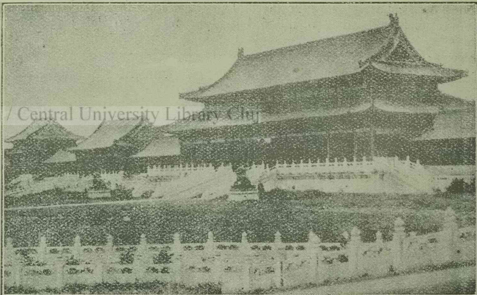
Sokáig volt veszedelemben Kina egykori fővárosa Peking, amíg a japán bombavető repülőgépek a város felett cirkáltak. Sokan attól tartottak, hogy Peking is Sanghai sorsára jut és elpusztulnak a felbecsülhetetlen értékű évezredes műemlékek, kincsek, ami azonban nem következett be. — Képünk az egykori császárok palotáját ábrázolja.