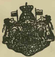
Montenegro fejedeleme udvari szállítója.