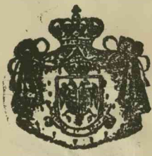
Szerb királyi udvari szállító.