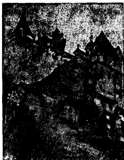
Un castel medieval