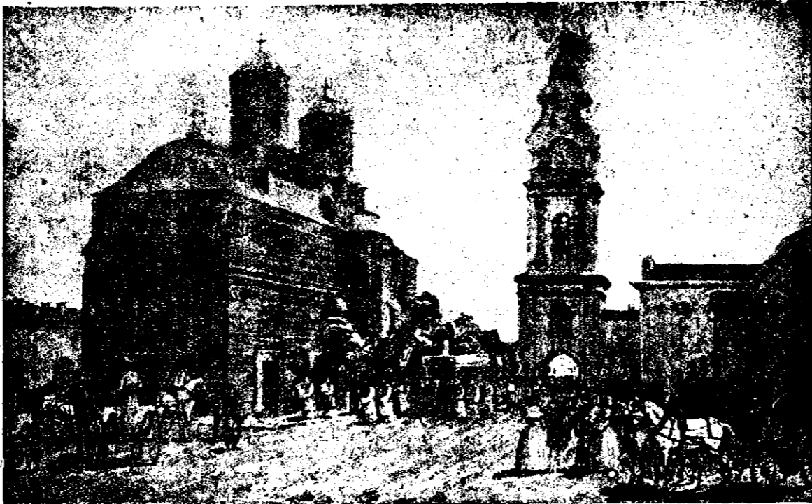
Biserica „S-ftii Trei Ierarhi“ din Iași