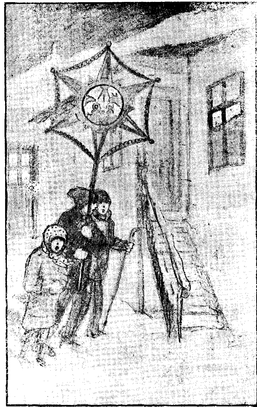
Copii umblând cu steaua.

Jucăriile americane sunt practice, chiar ingenioase, durabile, însă le lipsesc în cea mai mare parte din acele înfrumusețări de eforturi artistice. Ele pot fi instructive chiar oamenilor maturi.