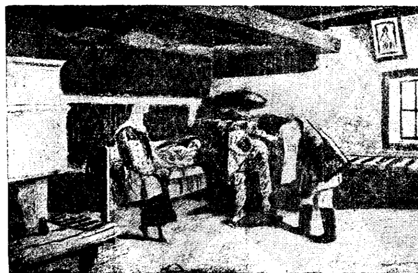
Interiorul unei case de țară

aplecă la un semn și legiunile încerate tam-ne sam fură despărțite, ridicate și cât ai clipi «te renul» curățat... Maiorul, făcând haz nespun mă pofti în cabinetul de lucru să luăm cafeaua.