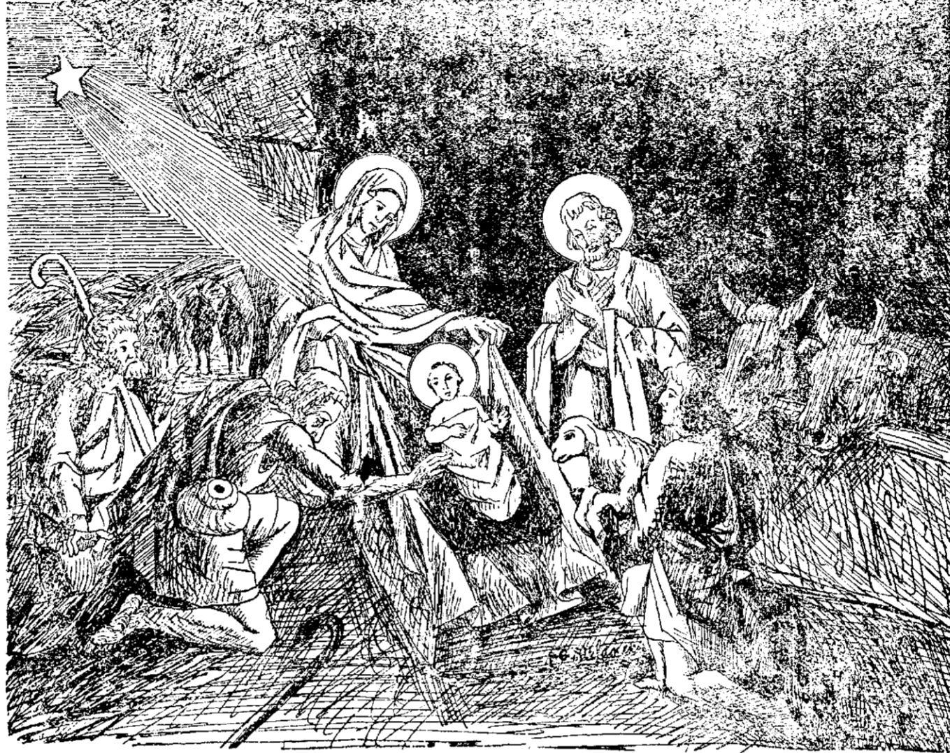
Nașterea Mântuitorului Lumii.