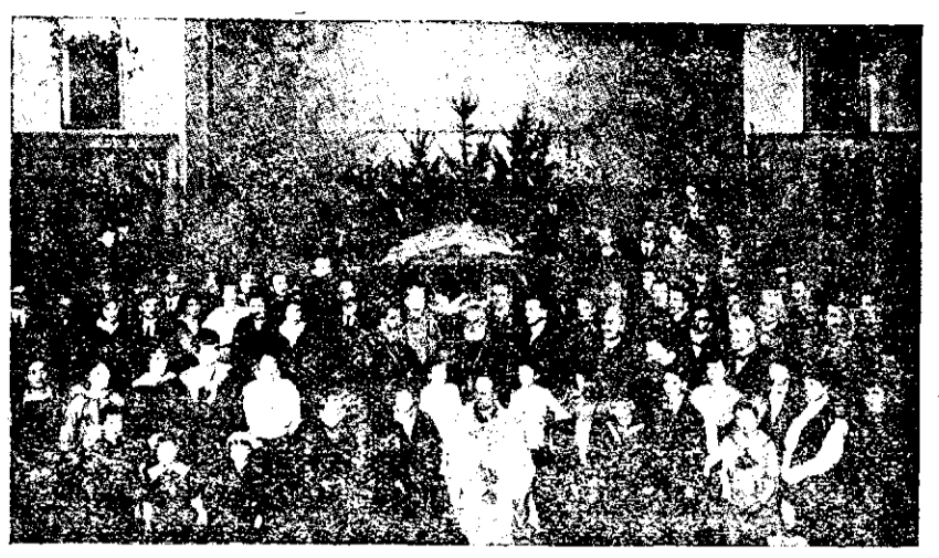
Serbarea Pomului de Crăciun