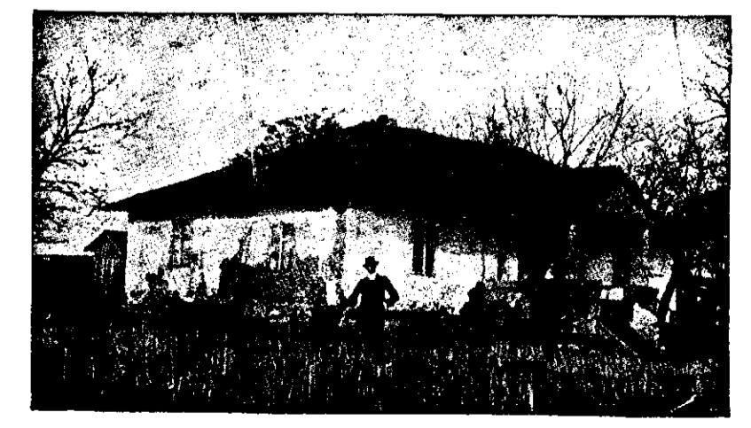
O casă țărănească.

— Cetiți și răspândiți „Cultura Poporului”