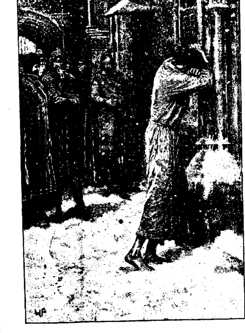
HENRIC IV LA CANOSSA In evul de mijloc (476-1453) puterea papală ajunsese la culme. Papa avea drept să investească (întărească) pe episcopi în scaunele lor. Henric IV, împărat al Germaniei (1056-1106), călca în picioare acest drept papal. El și investise episcopii. Papa Gregorie VII îl excomunică și îl declară detronat. Henric IV, părăsit de toți, fu nevoit să se ducă să ceară iertare papal, care se găsea în iarna aceea (1077) la Castelul Canossa. Trei zile în șir a bătut la poarta castelului, cu picioarele goale și cu haina de porcăniță. În cele din urmă papa îl iertă.