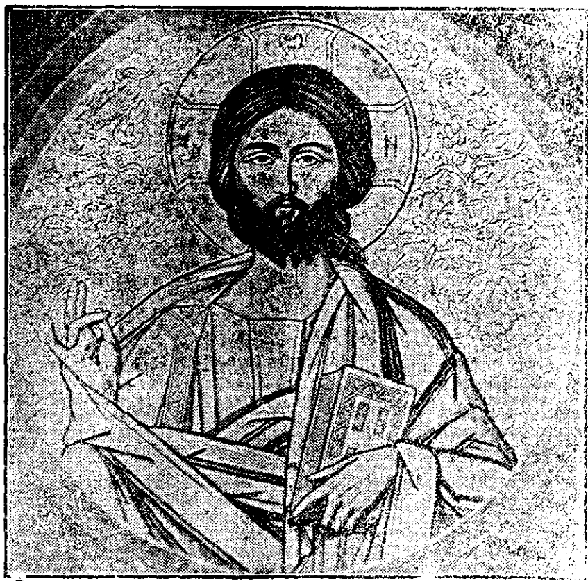
Duminică 3 Martie